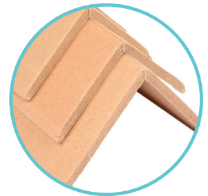
Sarok és élvédelem a szállítmány stabilizálásában segítenek, védik a csomagot a sérülésektől